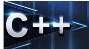
C++应试策略与要点解析