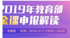
2019年教育部金课申报解读