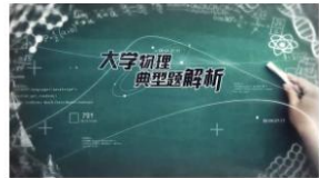
《大学物理典型题解析 (下)》考...