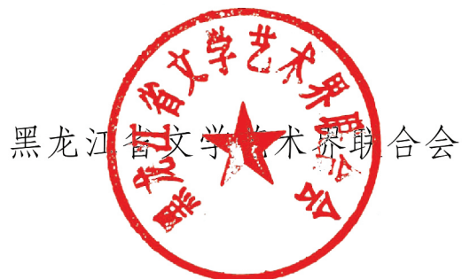
黑龙江省文学艺术界联合会