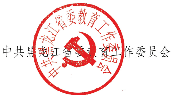
中共黑龙江省委教育工作委员会