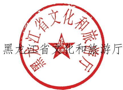
黑龙江省文化和旅游厅