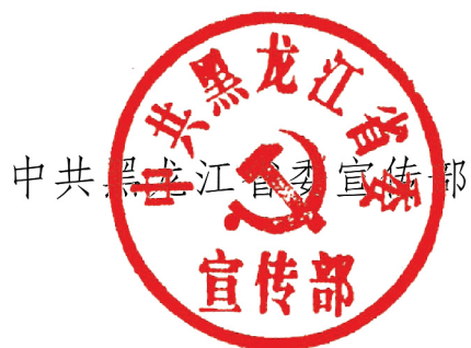
中共黑龙江省委宣传部